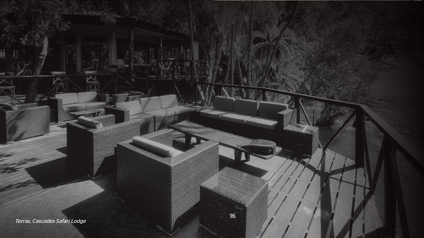
Terras, Cascades Safari Lodge