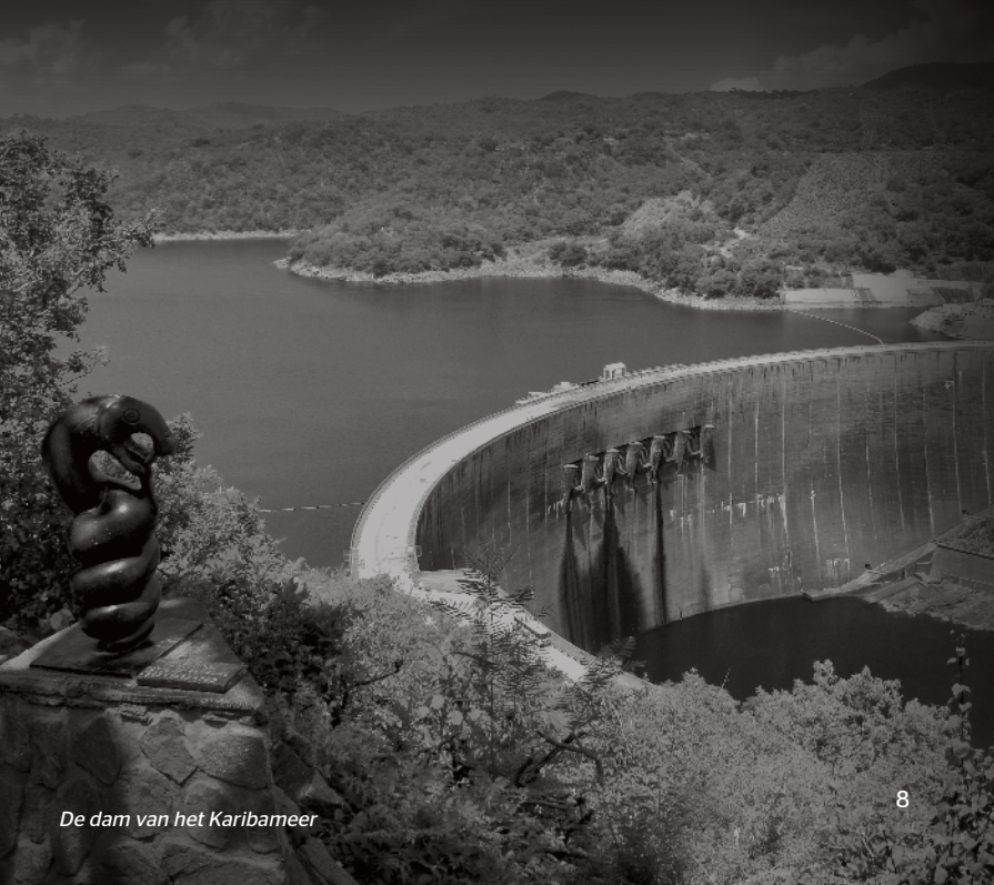
De dam van het Karibameer

Vandaag is Nyaminyami nog steeds aanwezig in de geesten van de mensen, maar hij wordt nu beschouwd als de beschermer van het meer en zijn bewoners.