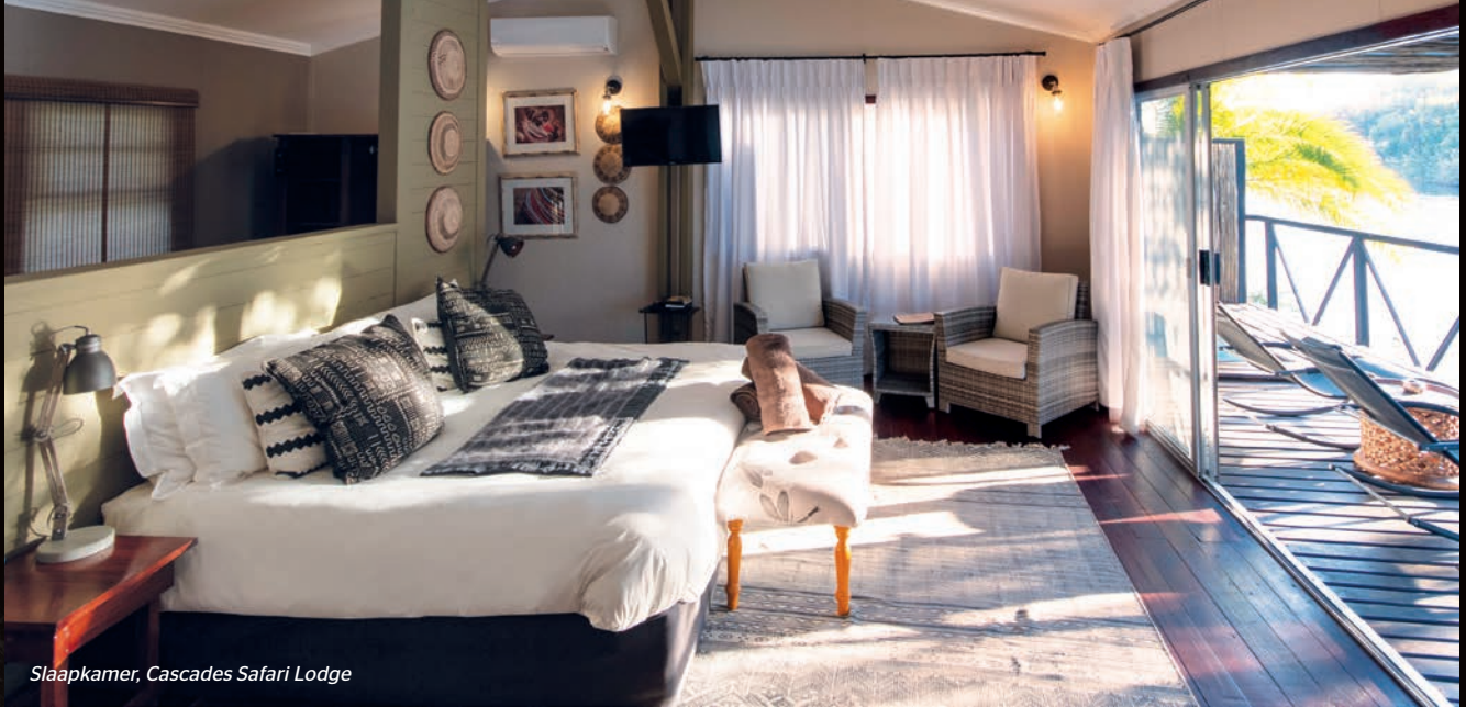
Slaapkamer, Cascades Safari Lodge