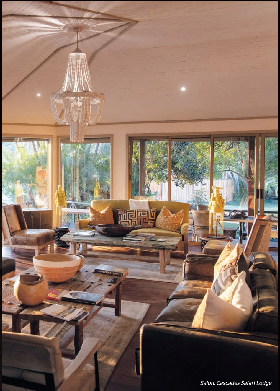
Salon, Cascades Safari Lodge