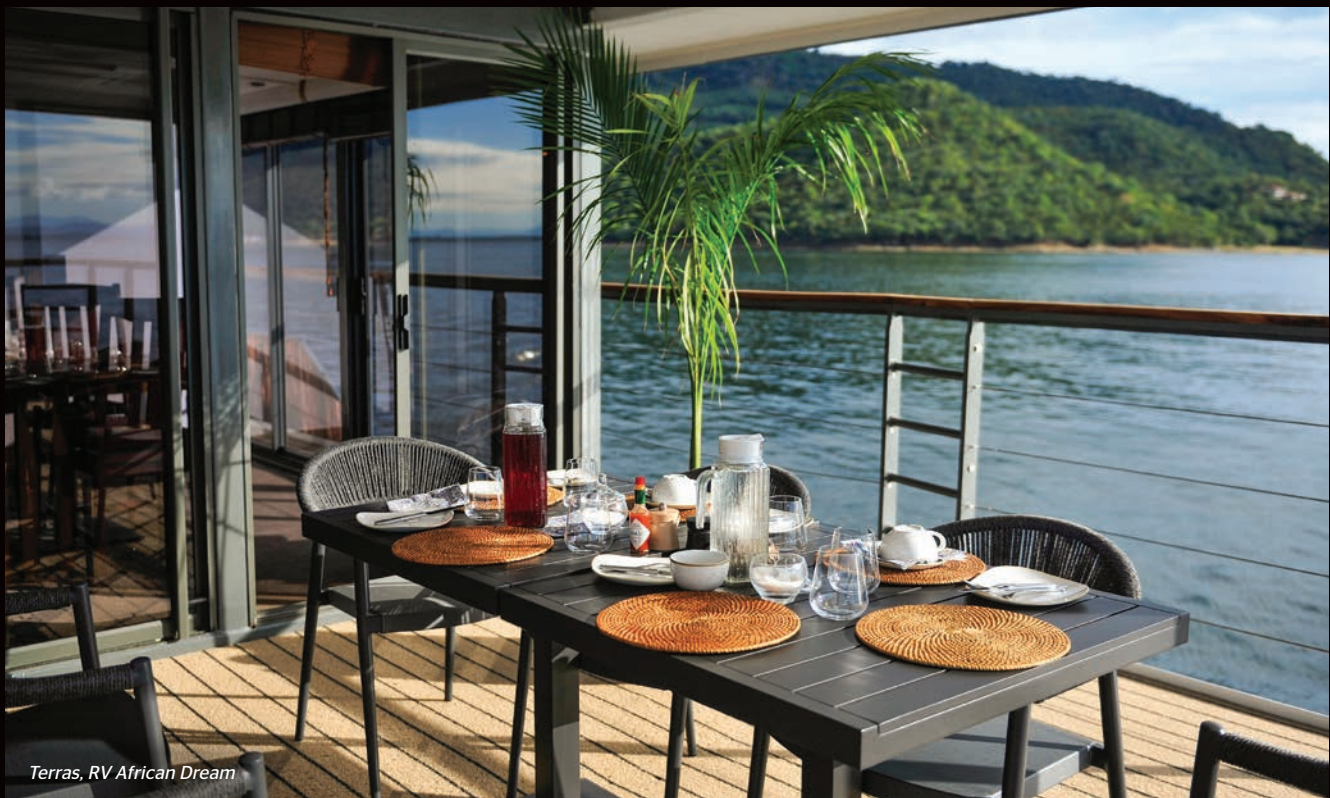
Terras, RV African Dream