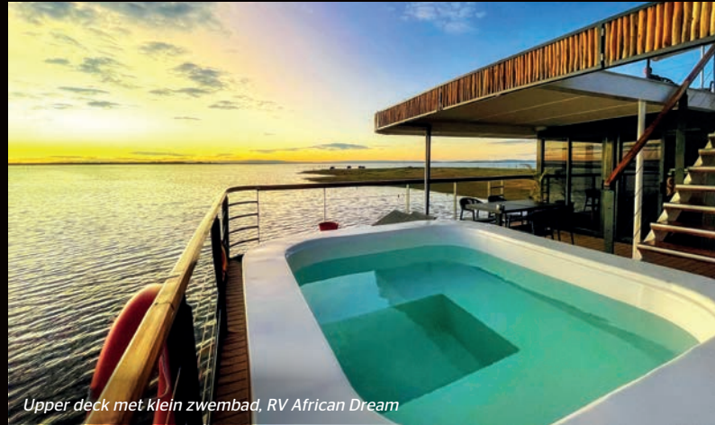
Upper deck met klein zwembad, RV African Dream