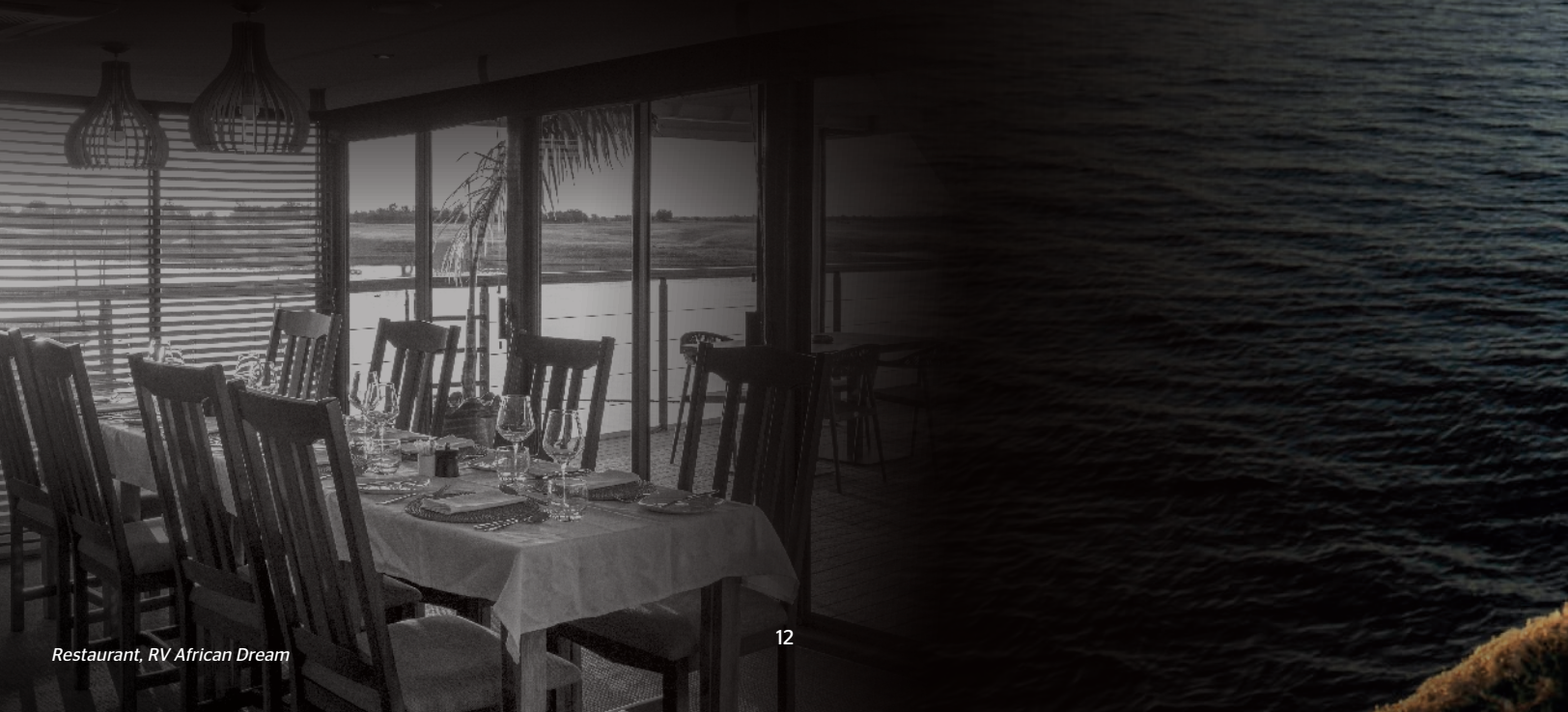
Restaurant, RV African Dream