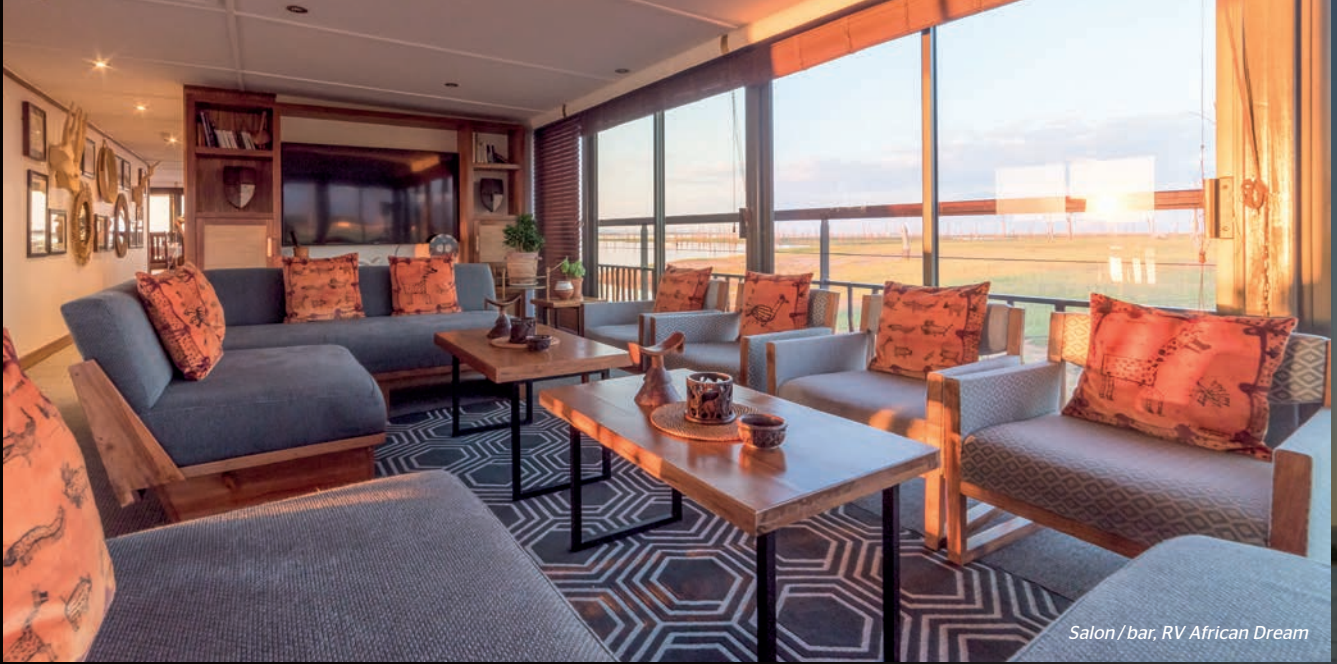
Salon / bar, RV African Dream